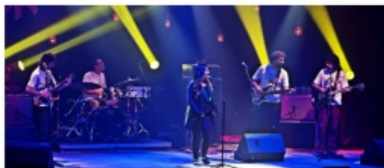
Leminskanglês, 3 e 4 de outubro por Sesc Ginástico, com o filme 'Leminski' e o espetáculo musical 'Leminski-se tenta' por Sesc Ginástico

RIO — Se estiver vivo, o múltiplo Paulo Leminski teria completado 70 anos em junho. Poeta, crítico literário, biógrafo de Baudelaire, tradutor de Joyce, Beckett, Joyce e Malraux, Leminski foi também compositor e autor-poeta de jazz. Múltiplo, ele terá suas diversas facetas celebradas pelo projeto "Leminski-se tenta", que se inicia nesta quarta-feira e segue até sexta-feira no Sesc Ginástico.