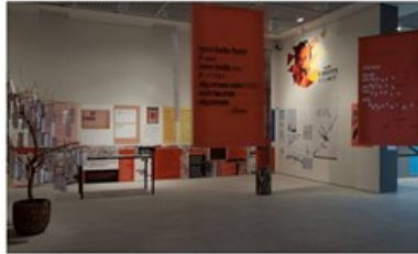
Espaço dedicado à poesia de Leminski explora todas as etapas do seu processo criativo.