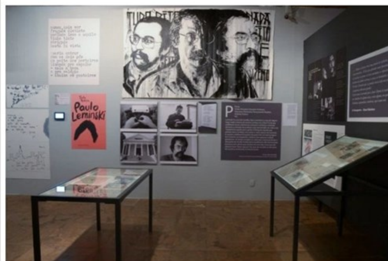
Múltiplo Leminski RJ ( Ilustração Izolag)

Os cariocas têm até o dia 20 de março (domingo) para conferir a mostra Múltiplo Leminski , na CAIXA Cultural Rio de Janeiro. Com entrada franca, a exposição acontece de terça a domingo, das 10h às 21h. Esta é a última oportunidade para conhecer o acervo do poeta e multiartista curitibano Paulo Leminski (1944-1989), que reúne mais de mil objetos originais entre fotos, livros, pinturas, poesias, vídeos e filmes.